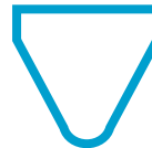
Triangle : tablette :25" (64cm) X 25" (64cm)

Hauteur ajustable: de 25 ½ pouces (65cm) à 37 pouces (94cm)